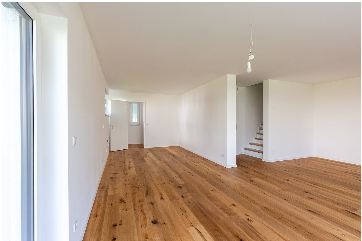
Küche mit Speise